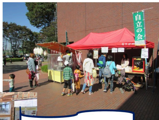
とちぎ協働まつり 2015