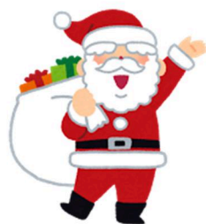
合同クリスマス会 《サンタさんと一緒に》