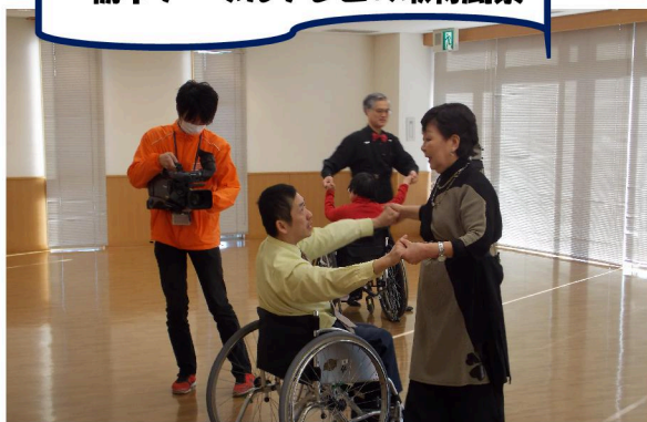
車椅子ダンス教室 栃木ケーブルテレビの取材風景