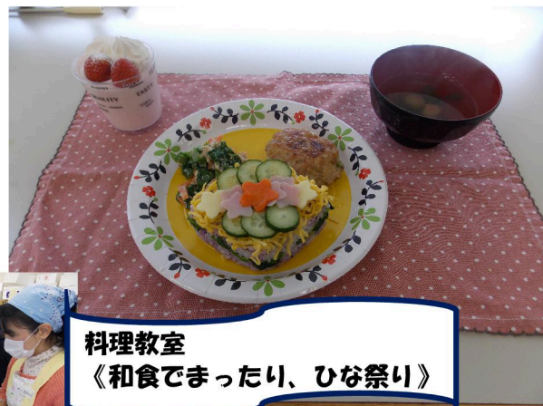
料理教室 《和食でまったり、ひな祭り》