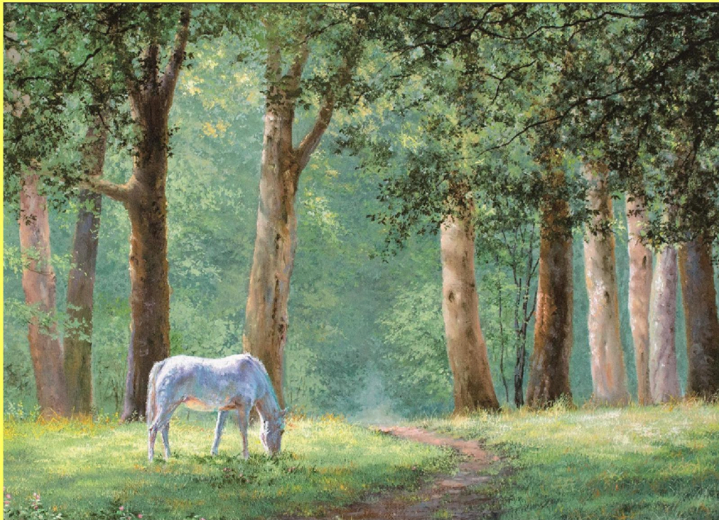
"David CRANE Ltd."©フオレストメア

明日に向かってはばたくなすびの里 障がい者在宅支援チャリティー企画 ～オールドイングランドの風と光を描く～